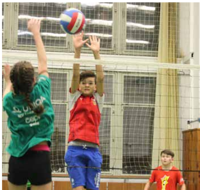
V NEJSTARŠÍ KATEGORII mezi sebou soupeřila dívčí a chlapecká tříčlenná družstva.

Pro některé děti to bylo vůbec první seznámení s touto hrou, pro ty starší to byly prestižní zápasy mezi jednotlivými ústeckými oddíly.