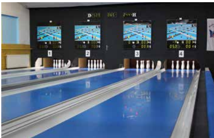
TEPLICKÁ KUŽELNA má čtyři moderně zrekonstruované dráhy.

tisíc korun. Příspěvek z Fondu Ústeckého byl 350 tisíc korun. Kompletní rekonstrukci prošly i čtyři dráhy, rozběžiště a dopaďišť. Teplická kuželna funguje již 53 let. Oddíl je plně amatérský. Kuželky jsou týmový sport, který se hraje s koulí o něco menší než je ta na bowling a bez děr na prsty. Kuželek je o jednu méně oproti bowlingu, kde jich je deset a také mají na dráze jiné postavení. Rozběhová deska má 5,5 metru a délka dráhy je 19,5 metru.