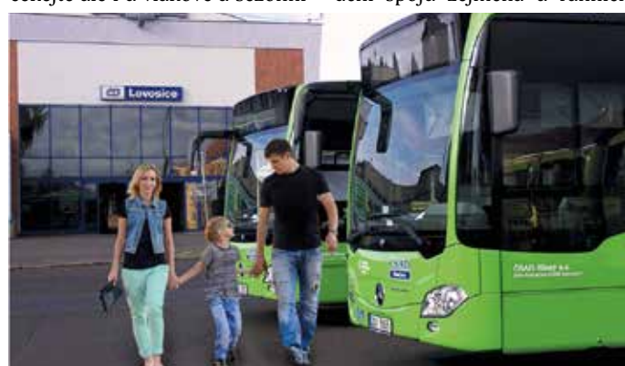
KOMPLETNÍ SEZNAM změn najdete na www.dopravauk.cz .

Pravidelná celostátní změna jízdních řádů se od 11. prosince promítne i ve veřejné dopravě Ústeckého kraje. Většina změn se tentokrát dotkne autobusové dopravy. Novinky čekat ale i u vlakové a sezónní