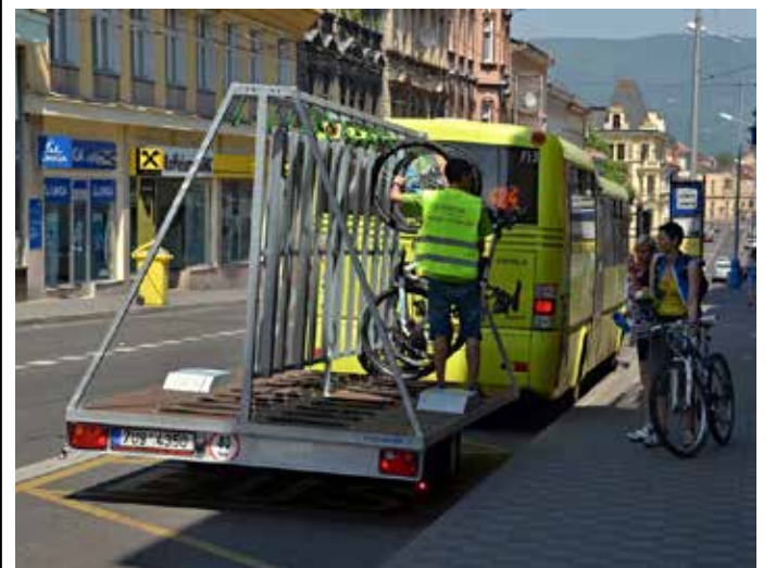
Z TEPLIC CYKLOBUSEM až na Komáří vížku.

Velké nárůsty zájmu cyklistů pak zaznamenaly i další autobusy DÚK, které nabízejí cyklistům vyvezení k cyklistickým trasám na vrcholcích hor – např. linka 452 z Ústí do Tisé a Mukarova, linka 588 z Chomutova na Křimov a Horu Svatého Šebestiána nebo linka 521 z Litvínova na Horu Sv. Kateřiny a Brandov. Zvýšení počtu přepravených kol je zřetelné také na 128 autobusových linkách DÚK, které jezdí v sezóně bez vleků nebo nástavby pro kola. Cyklisté si oblíbili i turistické linky DÚK – např. nová lodní linka 901 mezi Ústím a Litoměřicemi převezla 372 kol. Menší polovinu z celkového počtu kol pak přepravily krajské vlaky.