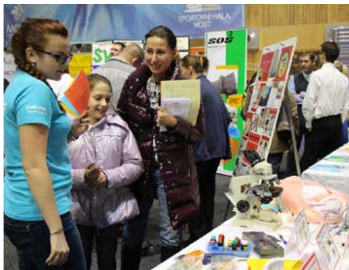
VELETRH splnil svůj účel.