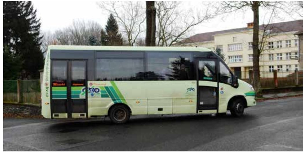
AUTOBUS jezdí přes Varnsdorf (ilustrační snímek).

Ve Varnsdorfu se nově zavádí krátkodobá přestupní patnáctiminutová jízdenka. Cestujícím z ostatních částí kraje integrace umožní využití jízdenek DÚK i v městských autobusech a trolejbusích Chomutova, Jirkova a Varnsdorfu. Ti, kteří přijedou do těchto měst meziměstskou linkou DÚK mohou pokračovat v cestě městskou dopravou bez potřeby kupovat další jízdenku (pokud jim ještě časově platí).