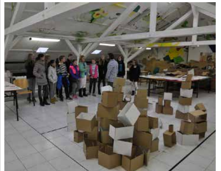
STUDENTI si prohlédli produkty obalové techniky.