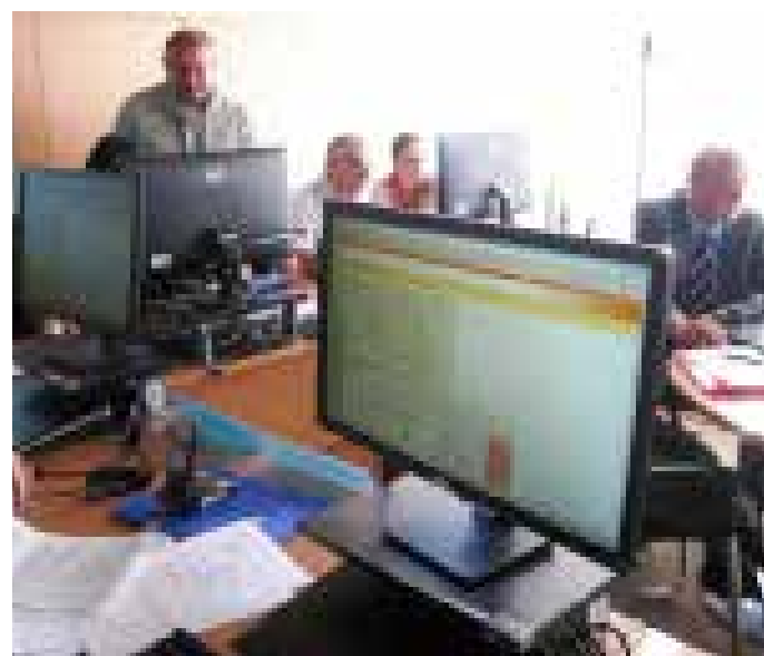
CVIČENÍ SE ZÚČASTNILI zástupci Krajského úřadu Ústeckého kraje.

Krizové štáby ORP musely pokaždé zhodnotit rozsah škod a přesně určit, jakou pomoc po-