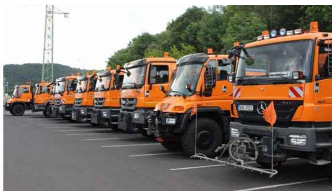
PŘED DVĚMA LETY se představila část flotily nových vozidel Správy a údržby silnic Ústeckého kraje na mosteckém autodromu.

Ne každá silnice je ovšem v plánu zimní údržby, zhruba 400 kilometrů po celém kraji jsou cesty, které se v zimě neudržují a jsou proto také označeny dopravními značkami. Ústecký kraj průměrně každý rok zaplatí za údržbu silnice ve svém majetku, tedy za silnice II. a III. třídy cca 170 milionů korun. Záleží ovšem samozřejmě na tom, jak moc tuhá zima bude. „Krajští silničáři se ale starají také o odklízení sněhu či námrazy ze silnic, které patří státu. Za tuto údržbu pak platí ministerstvo dopravy,“ dodala Holovská.