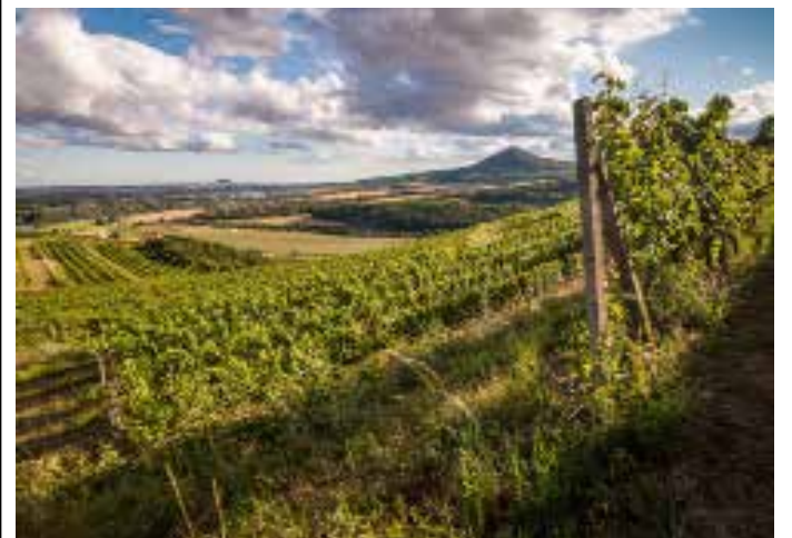
VINICE U VELKÝCH ŽERNOSEK na Litoměřicku.

zvyšil o 16,4 %. V posledním sledovaném čtvrtletí se zvýšil počet hostů v hromadných ubytovacích zařízeních o 7,6 % a počet