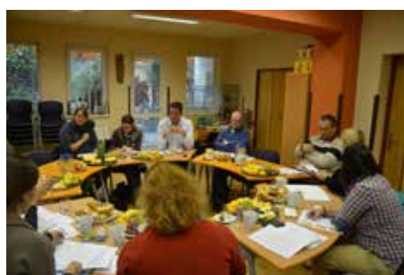
JEDNÁNÍ V DĚČÍNĚ se zúčastnily všechny zainteresované strany.

zahrady blíže prováží a získají zcela nový prostředek, jak posílit systém informova-