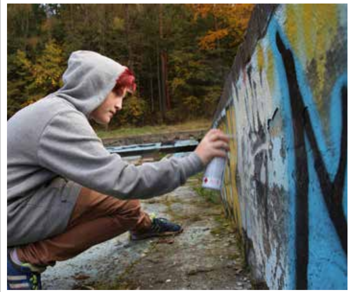
DĚTI SI VYZKOUŠELY i sprejování na zdi bazénu.