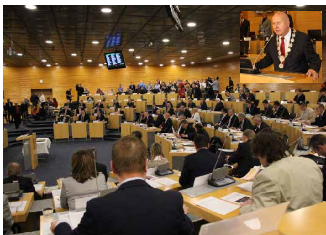
POPRVÉ OD VOLEB SE SEŠLO nové Zastupitelstvo Ústeckého kraje. Hejtmánem byl zvolen opět Oldřich Bubeníček (malá fotka).

Hejtmánem byl ve veřejném hlasování zvolen Oldřich Bubeníček, pro kterého hlasovalo 28 zastupitelů. „Věřím, že nově zvolená rada i noví zastupitelé budou mít společnou vůli pokračovat v naplňování dlouhodobých cílů a priorit kraje. Za necelý měsíc bude zastupitelstvo projednávat rozpočet kraje na rok 2017, který ve svých kapitolách navrhuje například prostředky na další opravy silnic, na opravy a vybavení škol i na zdravotnictví,“ řekl po svém zvolení staronový hejtmán.