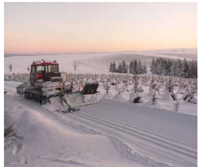
BĚŽKAŘI SE MOHOU TĚŠIT na upravené tratě (archivní snímek).