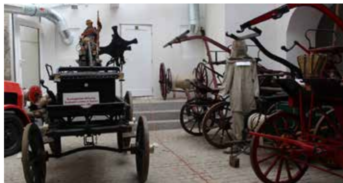
PROSTORY ZREKONSTRUOVANÉ BÝVALÉ BAROKNÍ FARY se návštěvníkům otevřely na podzim 2015.

Díky hodnotným darům od Nadace ČEZ, která svoji podporu směřuje i na celkový rozvoj občanské společnosti, mohou mladí hasiči techniku využít na tréninky na soutěže v požárním sportu.