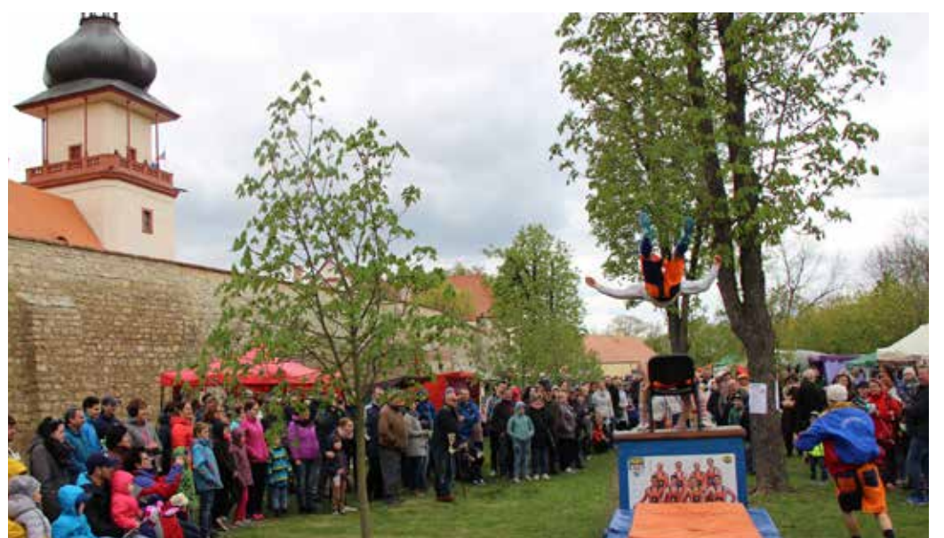
GYMNASTICKÉ KOUSKY skupiny Flying Boys.

V programu zaujala diváky kapela dobové hudby Musica Candra, všichni obdivně tleskali při zábavné gymnastické show Flying Boys a vystoupení skupiny historického šermu Korbel. Ve stáncích řemeslníků všichni objevovali rukodělné výrobky spojené s tématem Velikonoc, pomlázky i zdobená vajíčka.