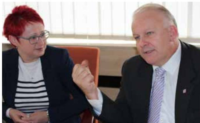
PETR KRČÁL vedle Petry Lafkové, vedoucí Odboru sociálních věcí.

zaměstnanců v sociálních službách 27 milionů korun. „Seznámil jsem pana náměstka s problémy práva, asi těmi největšími jsou vysoká zadluženost zaměstnanců sociálních služeb v Ústeckém kraji, stejně tak jsou na tom i seniři,“ dodal Martin Klika. V neziskových organizacích a sociální sféře pracuje v České republice na sto tisíc lidí. Náměstek Krčál přislíbil, že o situaci bude jednat s ministrem pro lidská práva Janem Chvojkou. Jak Chvojka, tak i jeho náměstek jsou ve funkcích od 1. ledna 2017.