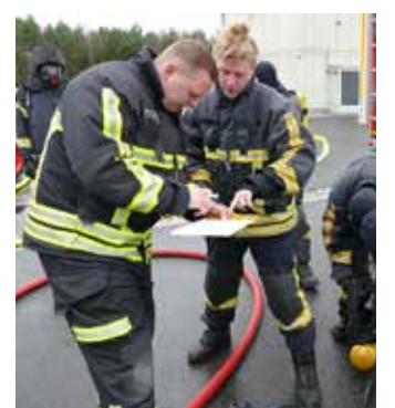
ČESKO-NĚMECKÁ spolupráce fungovala.

Mimo tuto odbornou část měli účastníci zajištěn bohatý kulturní program zaměřený na poznání prostředí a způsobu života v této části Saska, kulturních tradic i společenského života v současnosti. Absolvovali několik neformálních setkání nejen s profesionálními hasiči, se kterými prováděli výcvik, ale i s německou mládeží v klubu Ossi v Hoyerswerd.