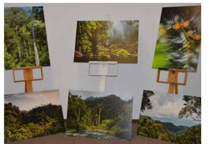
NA VÝSTAVĚ se objevily zdařilé fotografie.

Na vernisáži výstavy byla přítomna předsedkyně Výboru pro výchovu, vzdělávání a zaměstnanost Krajského úřadu Ústeckého kraje Radmila Krastenciová, která pozitivně hodnotila aktivitu žáků a jejich pedagogů na podporu jejich snahu a zapojení do činnosti, která má významný morální aspekt. Součástí vernisáže byla ochutnávka exotického jídla.