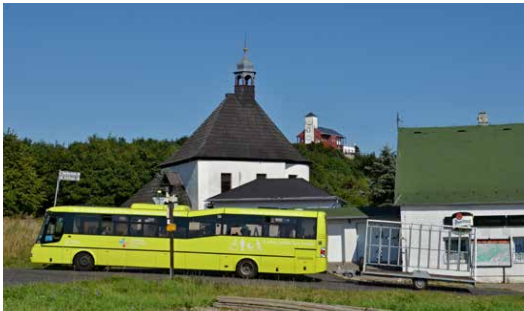
AUTOBUSY DÚK pod Komáří vížkou.

www.branadocech.cz www.dopravauk.cz www.sportkrupka.cz