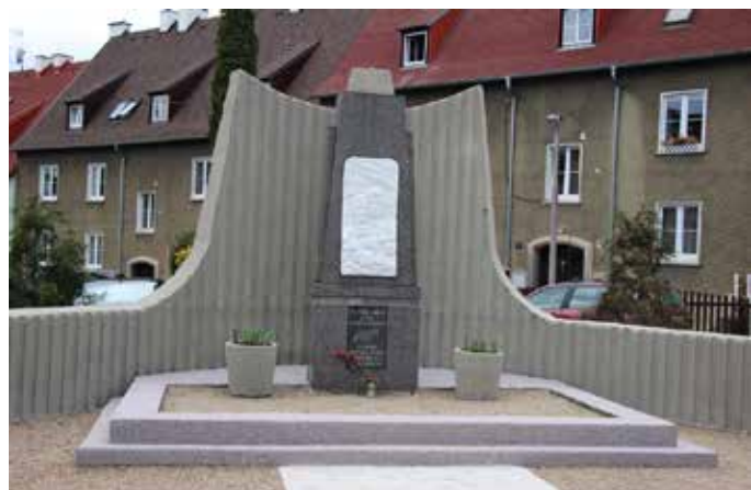
POMNÍK POMOHL ZREKONSTRUOVAT Český svaz bojovníků za svobodu.

me na ty, kteří položili životy za naši svobodu,“ řekl u pomníku hejtmán Oldřich Bubeníček. Generální konzul Ledeněv při-