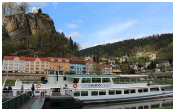
LOĎ ORION v děčínském kotvišti.

Loď Orion bude brázdit Labe každý víkend a ve svátky a od 1. června do 9. července také každé čtvrtky. Dopravcem na této trase je Labská plavební společnost.