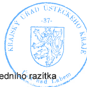
otisk úředního razítka

Den vyvěšení veřejné vyhlášky v tištěné podobě (datum, razítko, podpis)