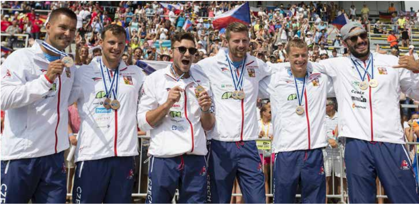
A TO JSOU ČEŠTÍ MEDAILISTÉ ze světového šampionátu.

obrátkách díky dobré práci v oddílech a s mládeží, čeští závodníci stabilně patří mezi světovou špičku, a to se promítlo v zájmu. Na šampionát přijelo 1176 účastníků z 65 zemí, v soutěžích parakanoistů se představilo 134 závodníků z 30 zemí. Nechybělo téměř 150 akreditovaných novinářů a osm televizních štábů. Česká televize odvysílala z mistrovství světa téměř deset hodin přímých přenosů.