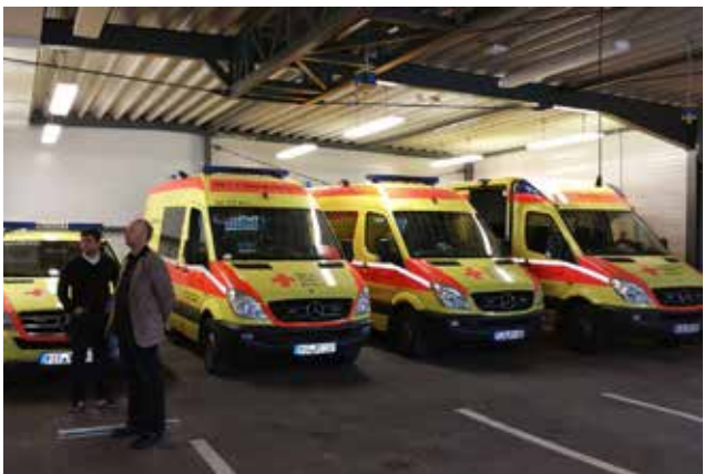
KOLEGOVÉ Z NĚMECKA jezdí s těmito vozy.

Připravil: Prokop Voleník, tiskový mluvčí ZZS ÚK, p. o.