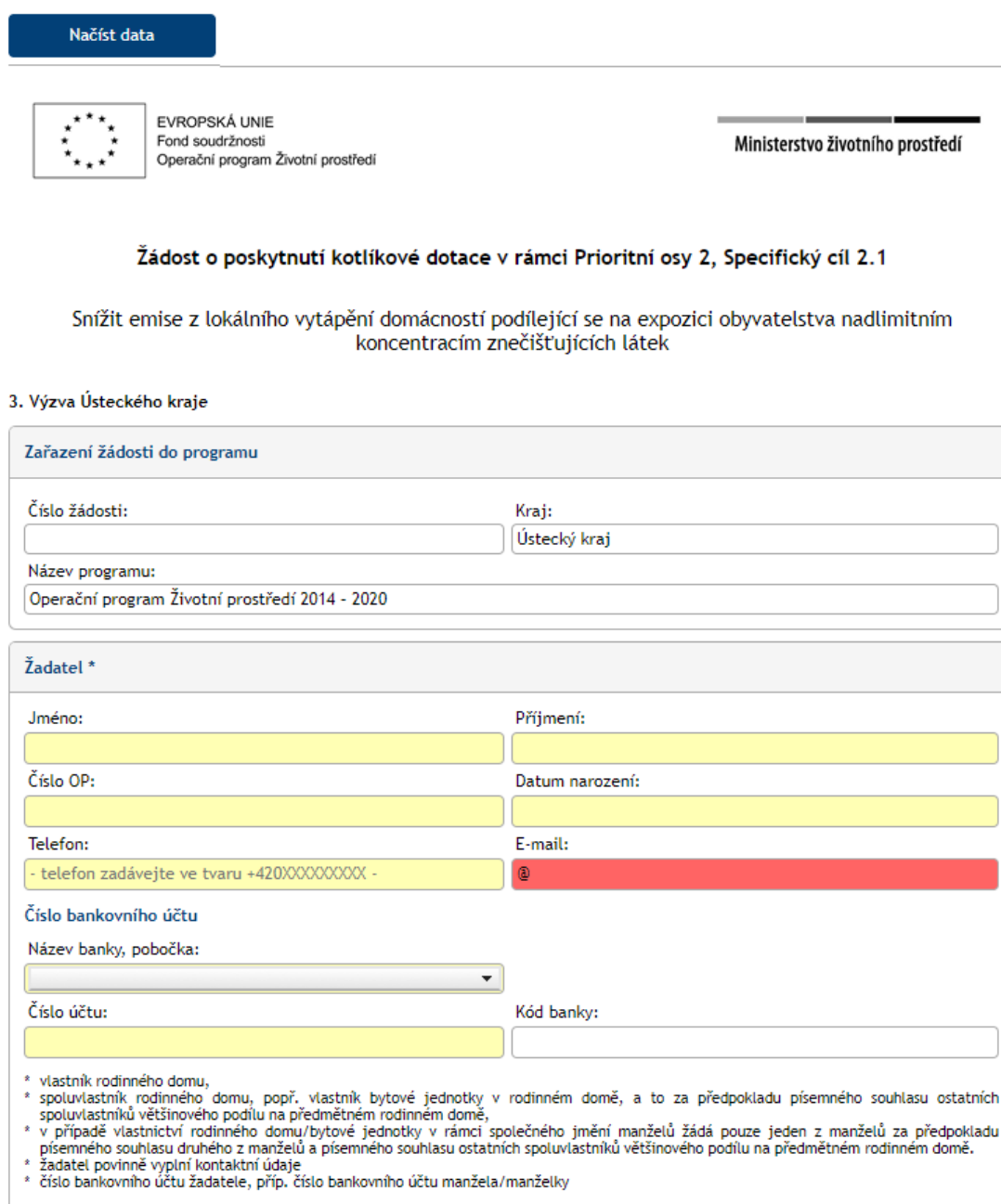
Obr. 1 Prázdná žádost – ukázka 1. strany žádosti

Po kliknutí na odkaz se Vám zobrazí prázdná (nevyplněná) žádost: