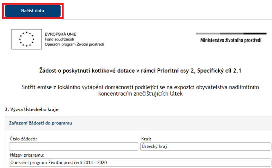
Obr. 8 Tlačítko pro načtení dat z disku

POZOR: otevřená žádost ponechaná bez činnosti po dobu delší než 30 minut se sama automaticky uzavře . Pokud nejsou data uložena, není možné data obnovit. Doporučujeme průběžné ukládání dat/formuláře!!! (Pokud tedy chcete rozpracovanou žádost doplnit později, uložte si data pro pozdější načtení).