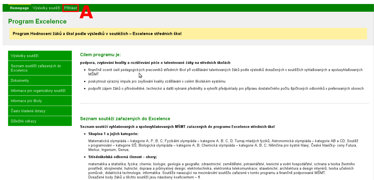
Obrázek 2.1: Úvodní stránka - „Homepage“

Z úvodní stránky („Homepage“) se na přihlašovací stránku dostanete pomocí menu položky „Přihlásit“ (viz obr. 2.1 - A). Menu se vždy nachází nahoře v tmavě zeleném pruhu.