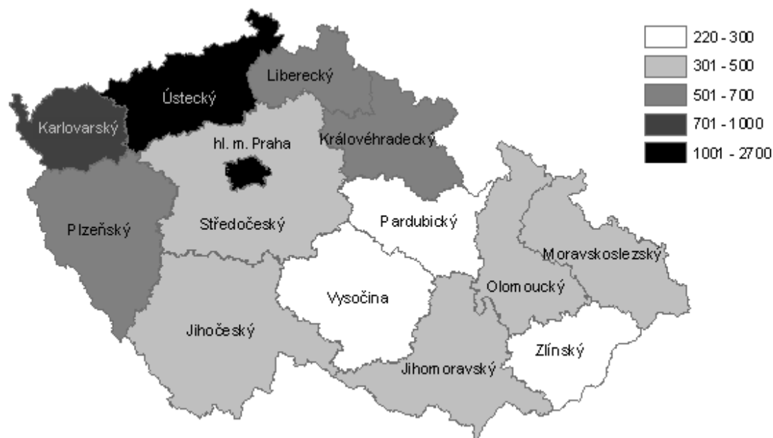
Graf č.2: Počet distribuovaných jehel a stříkaček v krajích ČR v r. 2012 na 1000 obyvatel ve věku 15–64 let