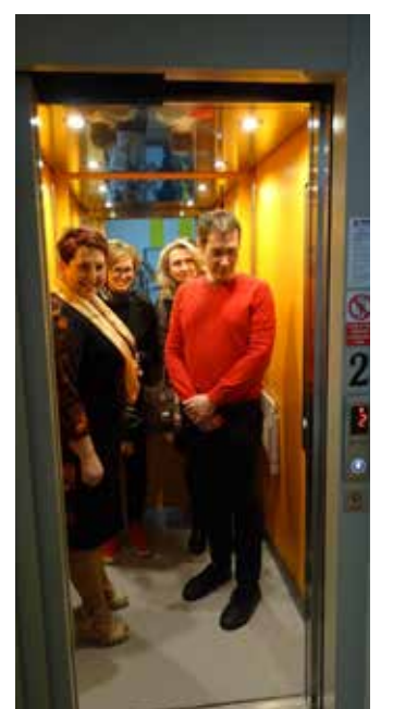
VÝTAH USNADNÍ ŽIVOT na škole nejen handicapovaným žákům.

vé jak pro žáky školy, tak pro přichozí hosty. I moudrá sova, nový maskot školy, měla příležitost výtah vyzkoušet.