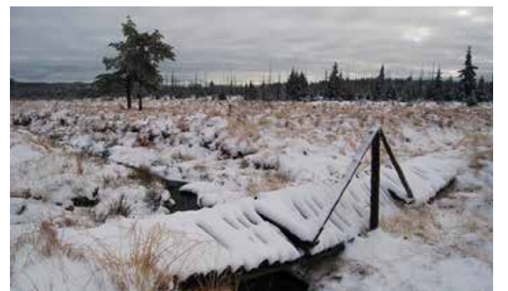
KRUŠNOHORSKÁ RAŠELINIŠTĚ jsou zajímavá i v zimě.

Nominace posílejte do 31. března na info@krušnohory.org a označte je Krušnohorská NEJ.