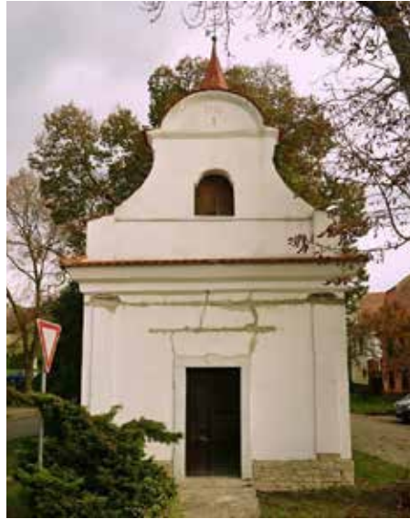
KAPLE SV. JANA A PAVLA VE STRAČÍ na Štětsku před a po rekonstrukci.

Prvním projektem je restaurování sochy sv. Jana Nepomuckého v Kadani, na který kraj přispěl částkou 190 tisíc korun v rámci Programu na záchranu a obnovu kulturních památek. Druhým, a za kraj vítězným projektem se stala obnova kaple sv. Jana a Pavla ve Strači u Štětí, o kterém rozhodla na svém jednání krajská sekce Sdružení historických sídel Čech, Moravy a Slezska v Klášterci nad Ohří. Tohoto vyhodnocení se zúčastnila i radní Ús-