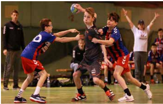
KLUČI DALI do finálového souboje všechno. A vyplatilo se.

Ústecká družstva se mezi téměř 70 družstvy ze čtyř zemí neztratila. Starší žáci Lovosice obsadili výběrné druhé místo, když v semifinále porazili Tatran Prešov a nestačili až ve finále na Ešes Veszprém. HK Baník Most doplněný o hráče z Loun, Lovosice a Varnsdorfu skončil v kategorii mladších žáků na pěkném 13. místě. Nejlepšího výsledku