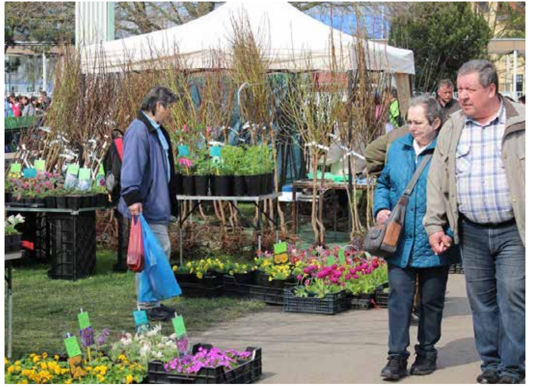
V LOŇSKÉM ROCE TRŽNICE ZAHRADY ČECH lákala návštěvníky do svého areálu.

Vrcholem sezony budou Vánoční trhy se Zahradou Čech, které se budou konat od 13. do 22. prosince na Mírovém náměstí v Litoměřicích.