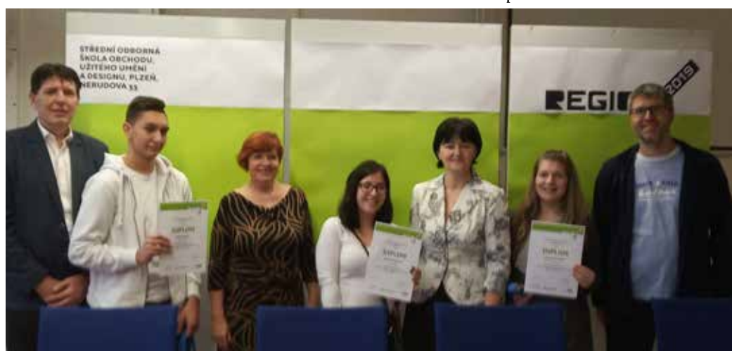
ŽÁCI SE PYŠNÍ DIPLOMY za třetí místo.