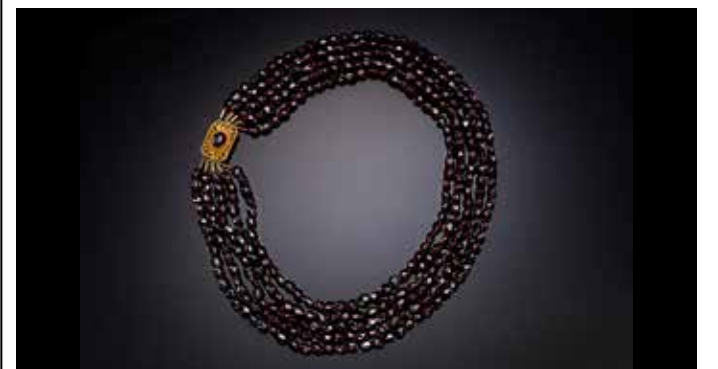
TAKÉ ZLATÁ SPONA NÁHRDELNÍKU je osazena velkým granátem, pravděpodobně vůbec největším granátem v České republice.

Příběh nenaplněné a neopětované lásky stárnoucího básníka patří mezi největší milostné příběhy evropské historie. Baronka zemřela v roce 1899 v Třebívlicích na Litoměřicku, kde byla majitelkou místního panství.