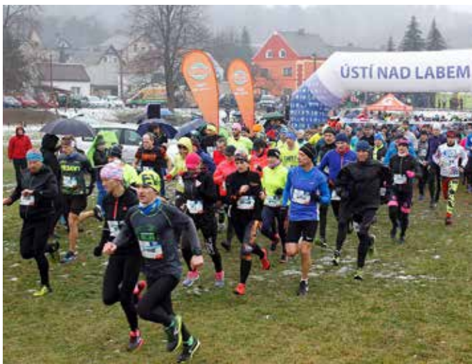
HLAVNÍ ZÁVOD měl velmi početné startovní pole.