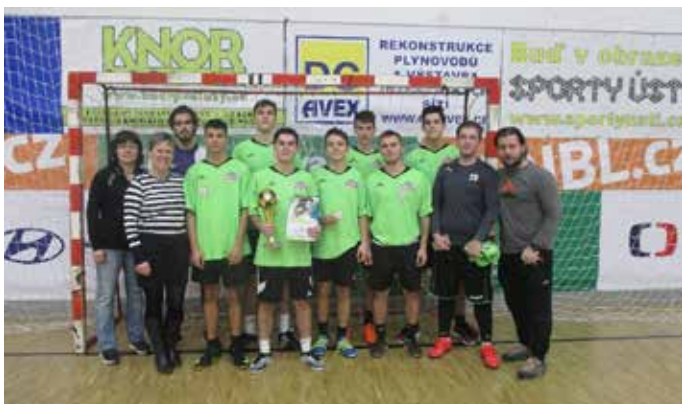
VÍTĚZNÉ MUŽSTVO kluků z ústecké stavárny.