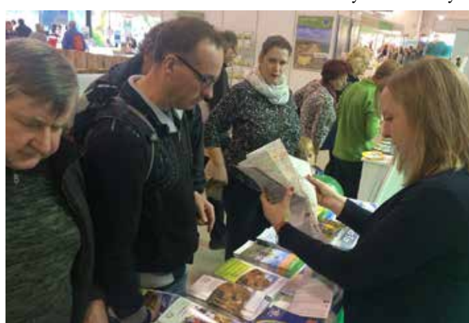
U STÁNKU ÚSTECKÉHO KRAJE bylo na drážďanském veletrhu Reisemesse Dresden plno.

návštěvníků. V saské metropoli se uskutečnil veletrh cestovního ruchu Reisemesse Dresden. Letos se zde představilo více než 400 vystavovatelských