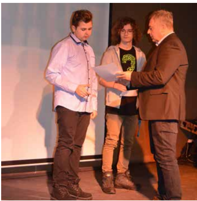
NÁMĚSTEK HEJTMANA PETR ŠMÍD předával oceněným diplomy.

V letošním roce se soutěže zúčastnilo 47 základních škol Ústeckého kraje zastoupených celkovým počtem 1 118 žáků. Počet přihlášených škol byl srovnatelný s loňským rokem, což dokazuje, že popularita soutěže Nejlepší mladý chemik Ústeckého kraje neustále stoupá. Soutěž je zařazena MŠMT do programu Excelence. Hlavním vyhlášovatelem, pořadatelem a generálním partnerem je Svaz chemického průmyslu ČR.