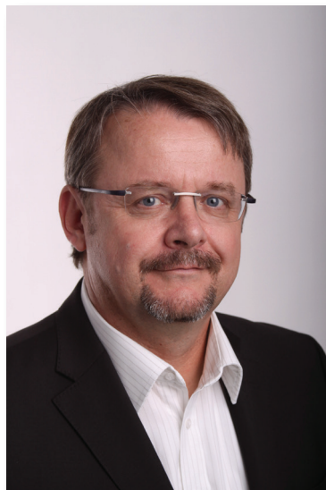
Ing. Dan Ťok, ministr dopravy České republiky

Ministerstvo dopravy podporuje projekt EUROKLÍČ již od roku 2009, prostřednictvím sponzorování tisku propagačních materiálů. V nich lidé najdou seznam míst, která jsou univerzálními Eurozámky osazena. Není to však jediný způsob, kterým tento prospěšný projekt podporujeme. Byli jsme zároveň prvním ministerstvem, které bylo Eurozámky vybaveno, na svých dvou zvedacích plošinách pro vozičkáře. Pro případ, že si návštěvník svůj klíč zapomene nebo jej nemá, máme k dispozici na recepci 20 kusů těchto klíčů k zapůjčení. Považujeme za samozřejmost, aby se hendikepovaní návštěvníci mohli bezproblémově dostat do naší budovy, a v podpoře celého projektu budeme rádi pokračovat i v příštích letech.