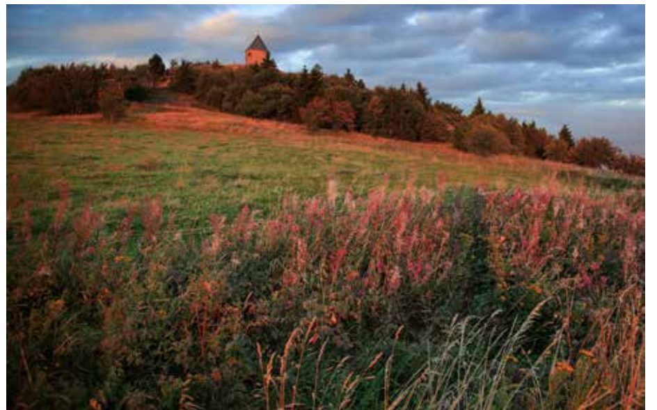
HORNICKÁ KRAJINA Mědník.

„Je pro nás ctí, že se Hornický region Erzgebirge/Krušnohoří ocitl po boku dalších památek světového dědictví. Na tuto chvíli dychtivě čekali i obyvatelé krušnohorského regionu, který se opírá o stovky let trvajících tradic společného soužití lidí na obou stranách hranice,“ řekla náměstkyně ministra kultury ČR Petra Smolíková.