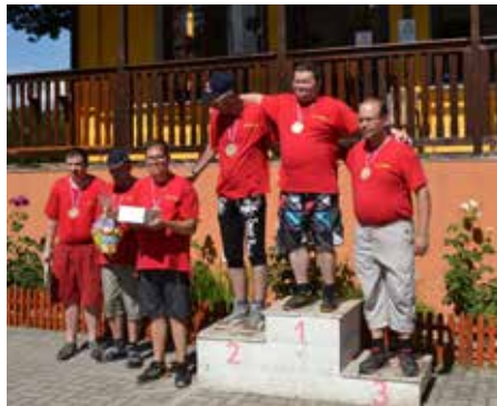
VÍTĚZNÉ DRUŽSTVO z Litvínova.

První den se sportovci zúčastnili štafetového běhu – Memoriálu Pavla Dvorského, kdy po dobu jedné hodiny běhali po vytyčeném okruhu s cílem zaběhnout co nejvíce kilometrů. Letos sportovci uběhli celkem 14 700 m. Samotné sportovní klání - „desetiboj“ pak začal druhý den. Všechny disciplíny bylo přizpůsobeno pro sportovce s těžším postižením.