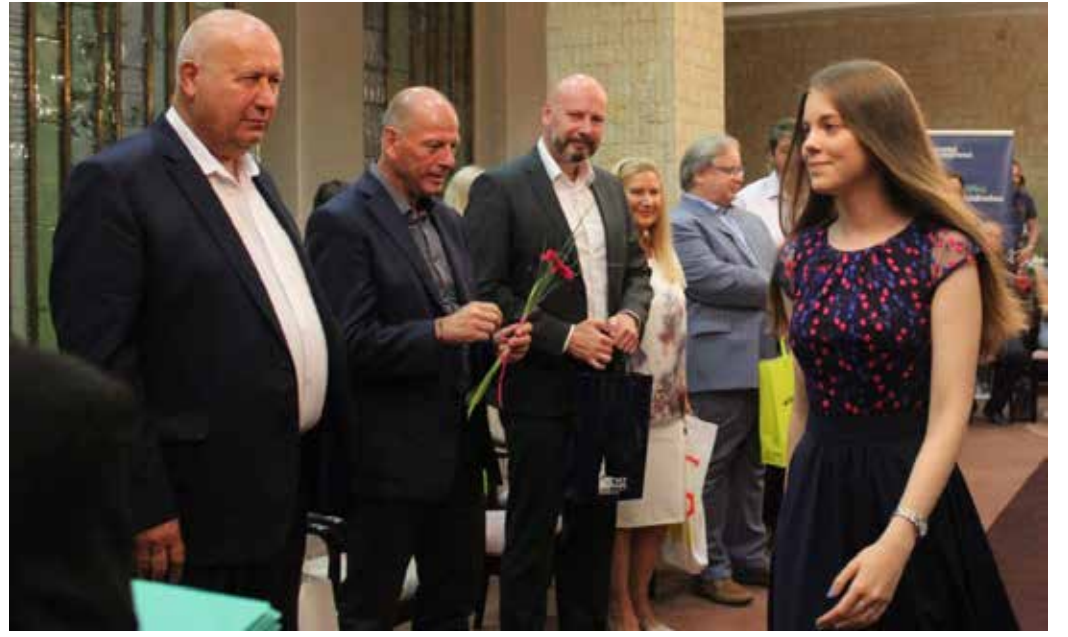
JEDNA Z OCENĚNÝCH si jde pro diplom.

Ani letos nechybělo ocenění Dobrym listem komory „Uznávaný tovaryš řemesla“, který převzali absolventi, kteří ukončili střední vzdělání výučním listem. OHK Most spolu se střední školou, která držitele navrhuje, dobrým listem garantuje odborné znalosti a dovednosti oceněných a je připravena tyto absolventy vstupující na trh práce dále doporučit zaměstnavatelům.