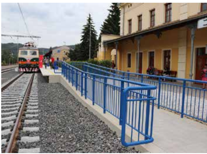
NÁDRAŽÍ DĚČÍN – východ prokouklo.

Železniční stanice je součástí tratí Ústí n. L. - Střekov - Děčín hl. n. a Děčín hl. n. - Česká Lípa. Opravné práce, které stály 143 milionů korun, začaly v září