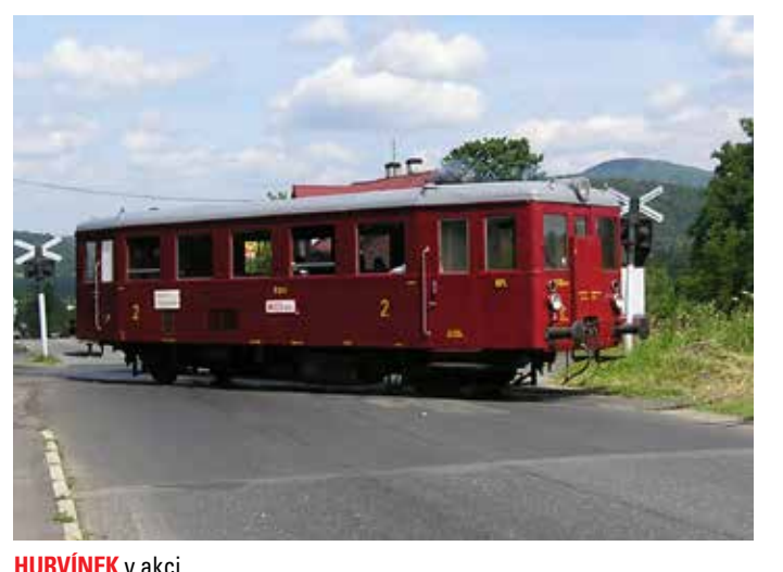
HURVÍNEK v akci.

má i trať – zřídila ji Česká severní dráha jako odbočku z České Kamenice k první sklářské huti v Kamenickém Šenově už v roce 1886. V okolí trati Vás vybidne k návštěvě řada zajímavých míst. Z České Kamenice se můžete vydat na zříceninu hradu Kamenice s dřevěnou rozhlednou nebo na čedičovou vyhlídku Jehla. Nejnavštěvovanějším místem v okolí dráhy je však Panská skála – národní přírodní památka a místo dalekého výhledu, kde se natáče i slavná pohádka Pyšná princezna. V Kamenickém motoráčku platí integrované jízdenky DÚK. Plnohodnotné jízdné z České Kamenice do Kamenického Šenova stojí 26 Kč, zlevněné 6 Kč.