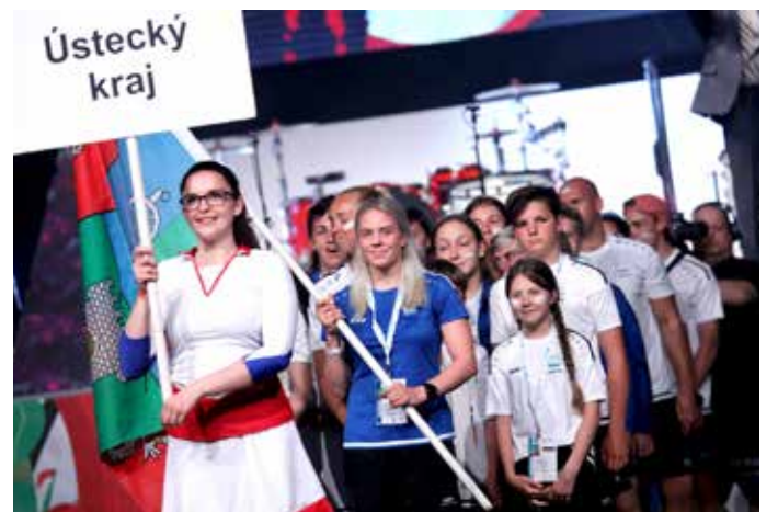
VLAJKONOŠKOU VÝPRAVY ÚSTECKÉHO KRAJE byla mistryně světa ve sportovním aerobiku Adéla Citová.