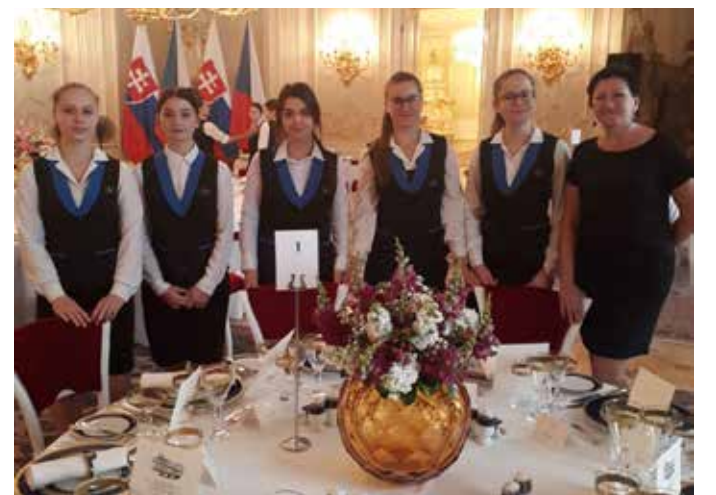
ŽÁCI A ŽÁKYNĚ se starali o slovenskou prezidentku.

A jak to probíhalo? Studenti byli hned po příjezdu na hrad rozděleni do různých funkcí a dostali svůj úkol. Následoval nácvik na banketovou obsluhu a poté samotná akce. Je již tradicí, že studenti hotelové školy získají v průběhu studia tuto cennou zkušenost – obsluhoval jsem na Pražském hradě.