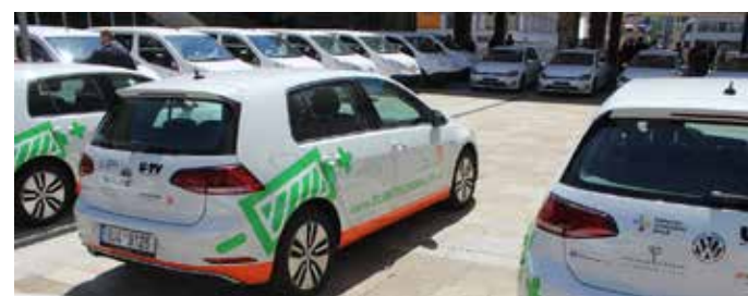
ELEKTROMOBILOVÁ FLOTILA Ústeckého kraje se rozrostla.

Na území Ústeckého kraje provozuje Skupina ČEZ aktuálně 19 veřejných dobíjecích stanic, z toho 11 rychlodobíjecích schopných doplnit 80 % kapacity baterie elektromobilu za 20-30 minut. Veřejné dobíjecí stanice ČEZ jsou k dispozici např. v lokalitách Ústí nad Labem, Děčín, Chomutov, Most, Teplice, Litoměřice, Trmice, Prunéřov, Ledvice nebo v Hrušovanech.