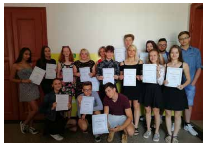
STUDENTI 3. ROČNÍKŮ s certifikáty z psaní na stroji.