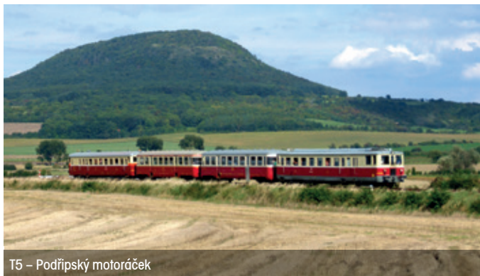
T5 – Podřipský motoráček

Trasa: historická železnice Libochovice – Mšené-lázně – Roudnice nad Labem