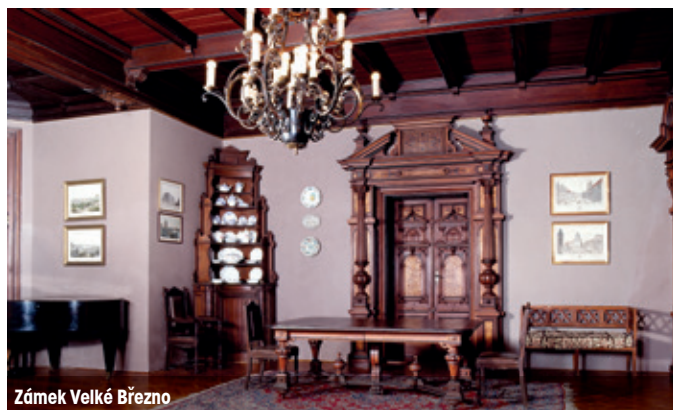
Zámek Velké Březno