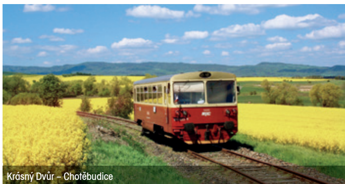
Krásný Dvůr – Chotěbudice