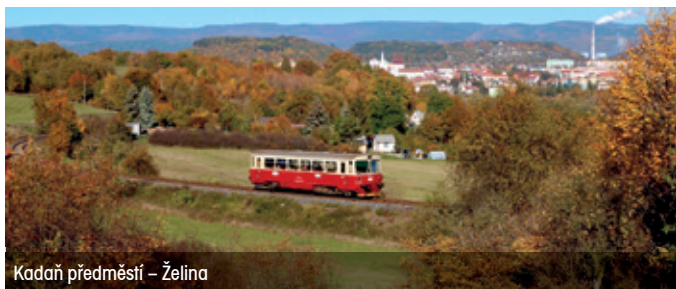
Kadaň předměstí – Želina