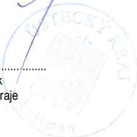
..... Oldřich Bubeníček hejtnan Ústeckého kraje