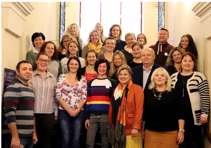
Obrázek 1: Fotografie zástupců členských organizací a hostů zasedání.