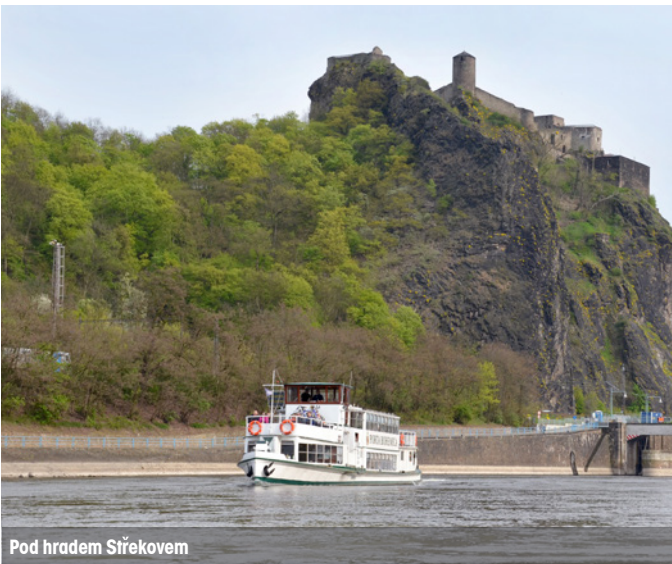
Pod hradem Srebrkovem