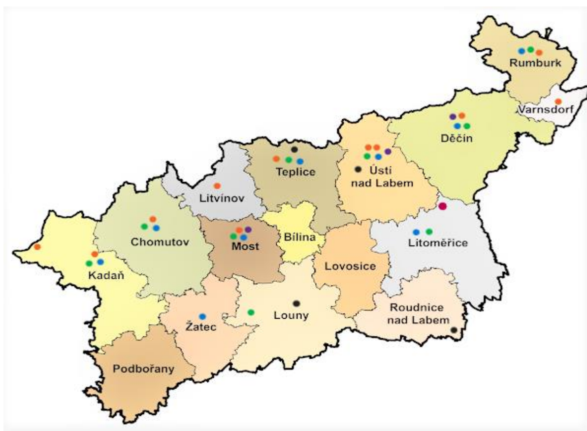
Obrázek 6: Grafické znázornění rozložení adiktologických služeb v Ústeckém kraji

Aktuální stav, potřeby a nedostatky v jednotlivých oblastech prevence jsou popsány v Akčním plánu v úvodních kapitolách zabývajících se současnou situací.