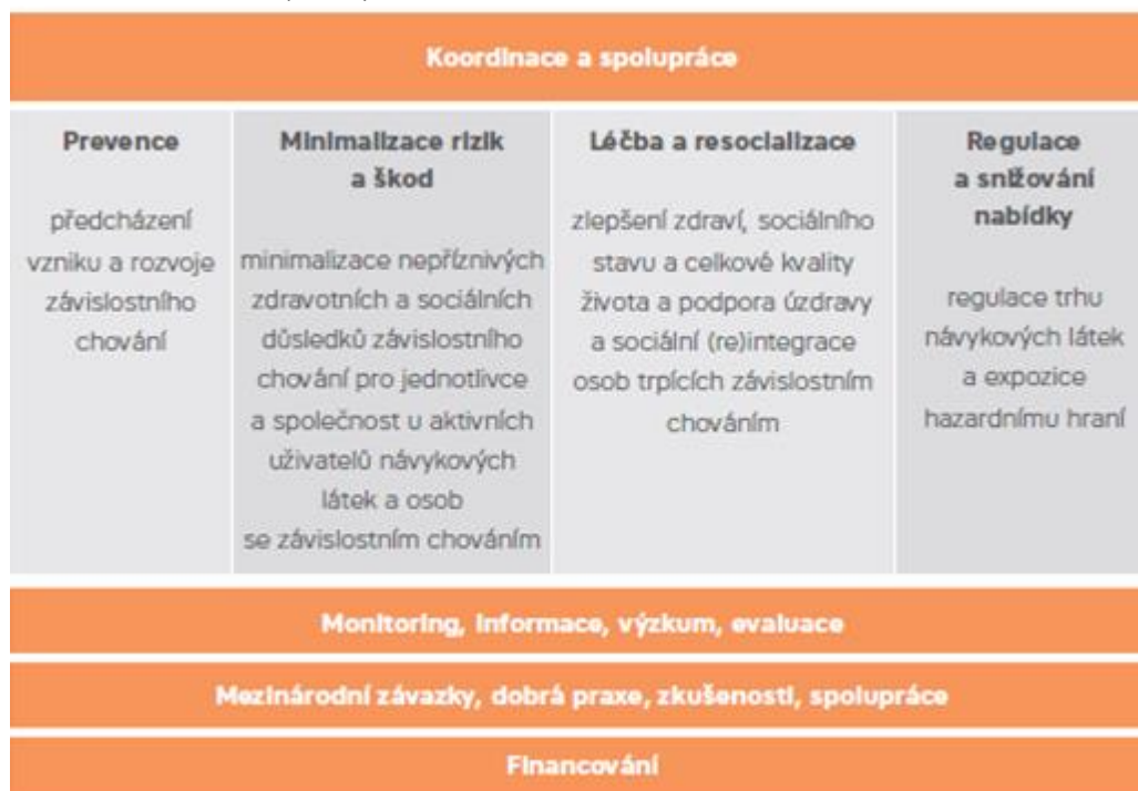
Obrázek 1: Struktura politiky v oblasti závislostí